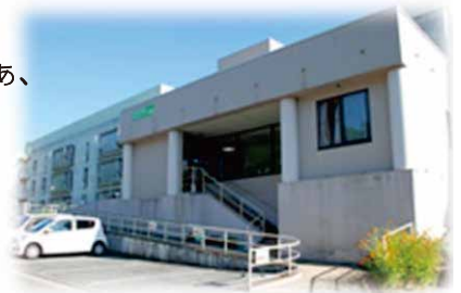
ホテル COCOLAND に隣接している宇部有料老人ホーム

現在はホームの生活にも慣れて、 日々楽しく 過ごしています。家族とは毎日メール交換をして、2か月ごとに県外から会いに来てくれるので心配はありませんね。